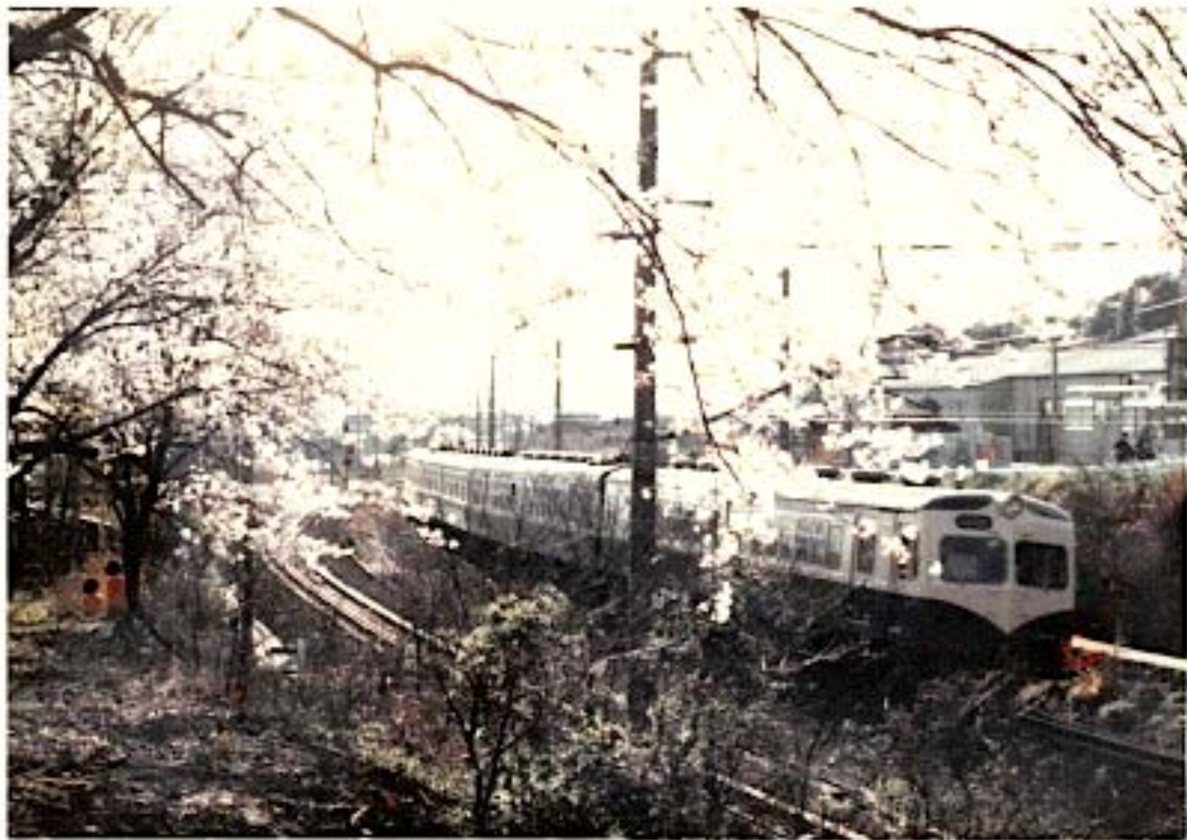
高蔵寺～定光寺 高座山上り口