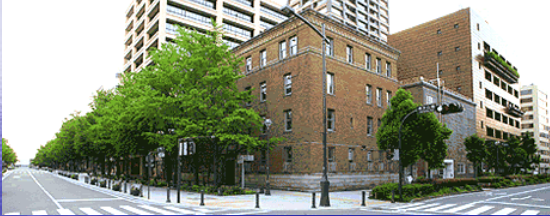
ZAIM(旧関東財務局・労働基準局事務所) (2006年6月～2010年3月) Office Buildings