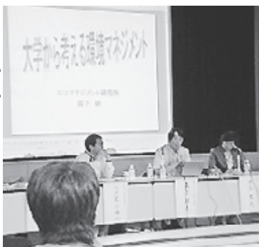
大学における「ゴミ問題」を討論

光熱費や廃棄物処理にかかわる経費の削減、環境レポートを作成し信頼性の向上を期待できる等実用的かつ優れた面が確認されています。大学が先頭に立って環境問題を考えていくことの意義が共有された講演会となりました。