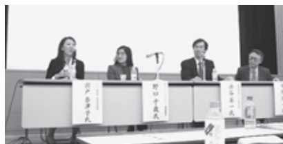
活発な議論が展開される講演会

21世紀社会デザイン研究科では、様々な分野で活躍する有識者らを招き、次代を切り拓くテーマを掲げた講演会を、年に何度も行っています。今回はその中から今年度に行われた4つの講演会についてご紹介します。