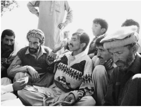
パキスタン・バーグ県にて。テントの配布先を話し合っている人々の様子

のがJENの支援です。この場合、「テントを配布するプロジェクト」が「道具」なのです。