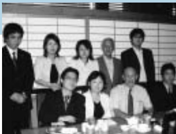
エズラ・F・ヴォーゲル博士(写真前列 右から2人目) 1930年アメリカ・オハイオ州生まれ。ハーバード大学東アジア研究所長を経て、2000年より同大学社会科学リサーチプロフェッサー。