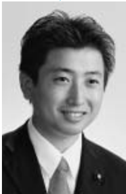
山内康一さん：2005年6月、自由民主党神奈川9区候補者公募で22人の中から選ばれて候補者となり、同年9月11日の解散総選挙に立候補して当選。

国際基督教大学時代は途上国の貧困に関心を持ち、開発経済学を勉強し、フィリピンに1年交換留学しました。卒業後JICAで4年働いた後、NGOに移ってジャパン・プラットフォームの創設に関わり、また、東チモール、インドネシア、アフガニスタン等のフィールドで働きました。NGO勤務を経てロンドン大学教育研究所に留学し、途上国の教育開発で修士号を取得しました。さらに公共経営やNPOマネジメントを勉強するため、働きながら学べる大学院を探し、21世紀社会デザイン研究科を選びました。